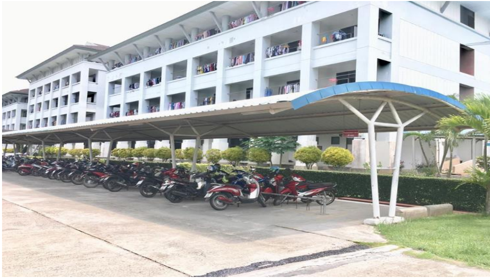
← โรงจอดรถจักรยานยนต์