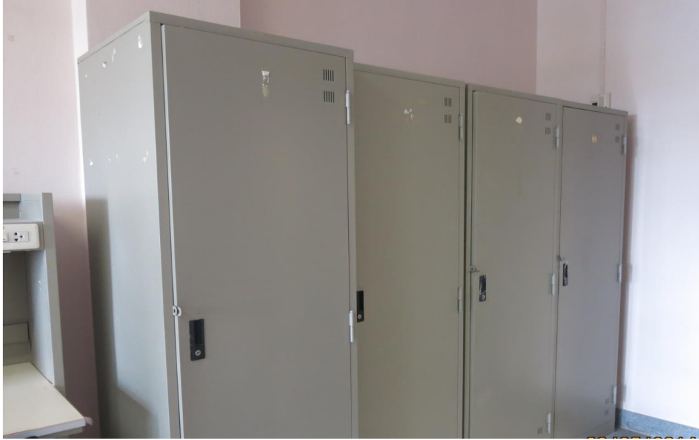
ตู้เสื้อผ้า