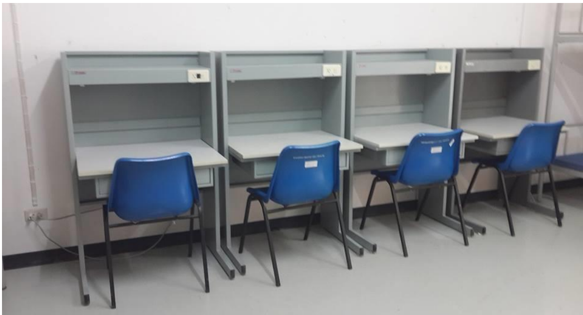
โต๊ะอ่านหนังสือพร้อมเก้าอี้