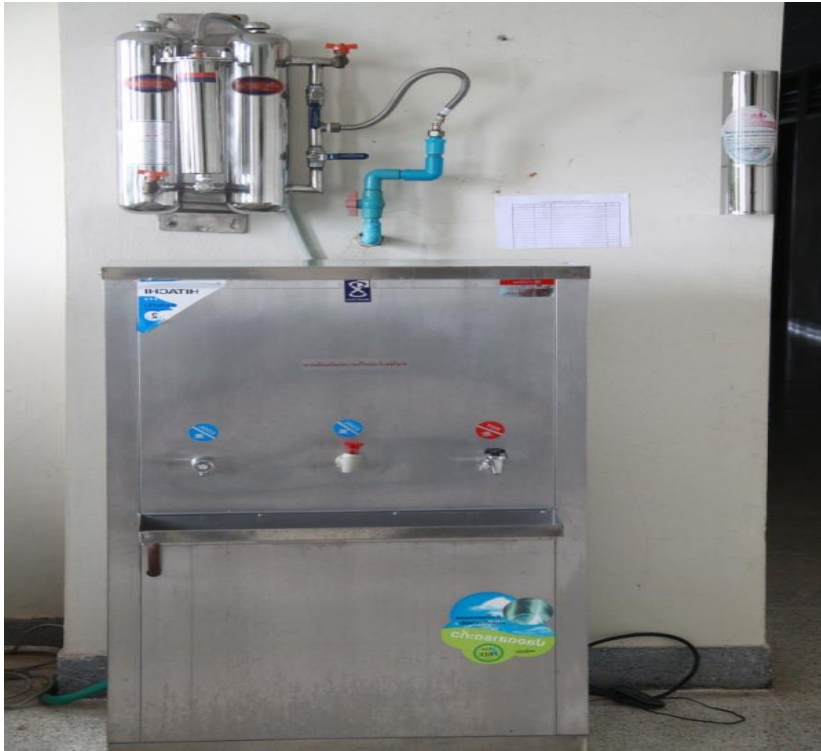
ตู้น้ำดื่ม