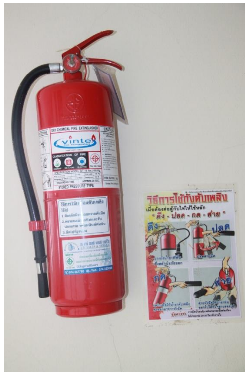
ถังดับเพลิงและ ระบบฉีดน้ำ ในห้องพัก