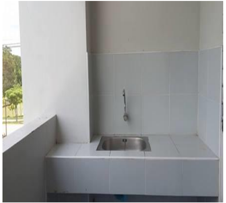
ระเบียงหลังห้อง