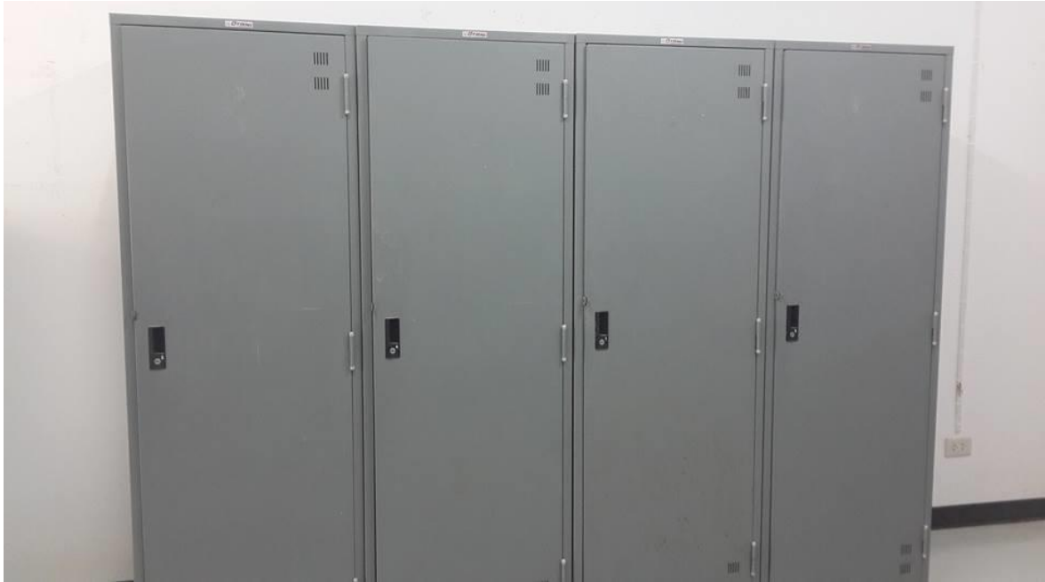
ตู้ใส่ผ้า