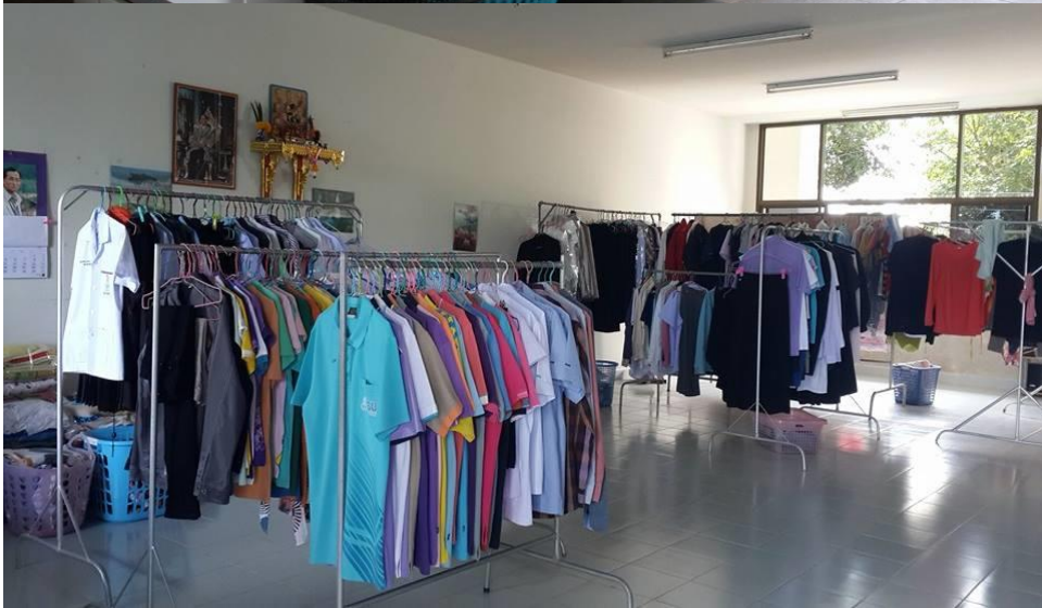
← ร้านซักรีด