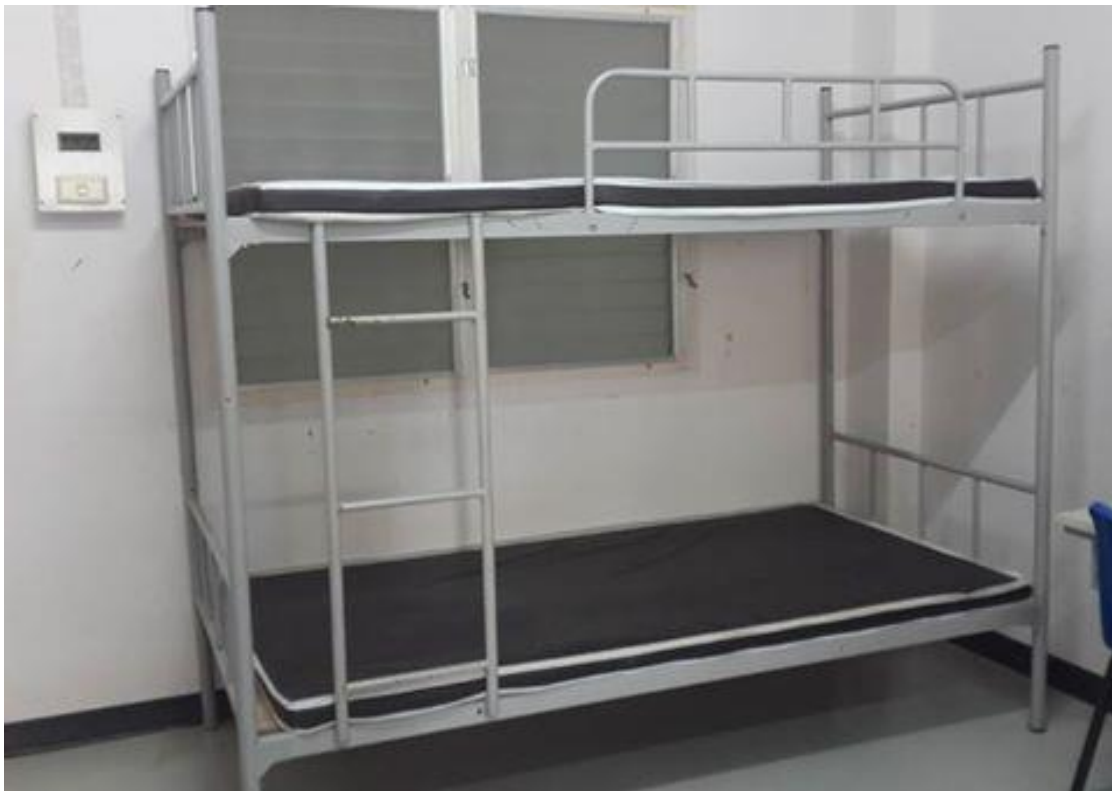
เตียงนอนพร้อมเบาะ