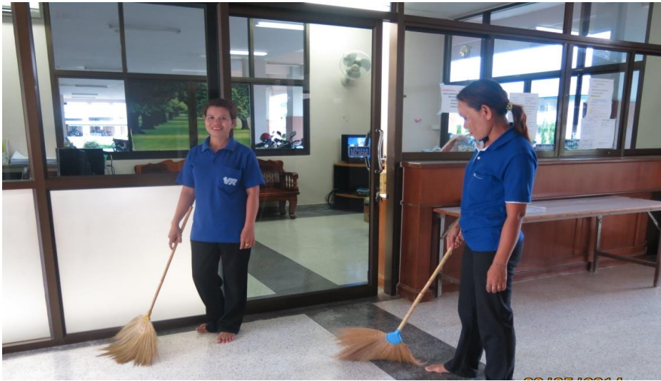
← แม่บ้านทำความสะอาด สะอาดทุกห้องพัก