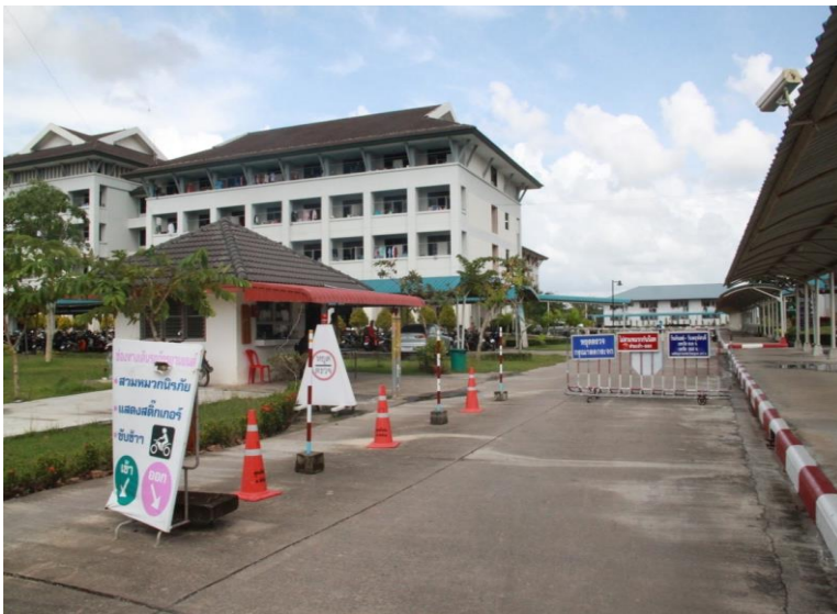
← ป้อมยามรักษาความปลอดภัยหอพักนิสิต