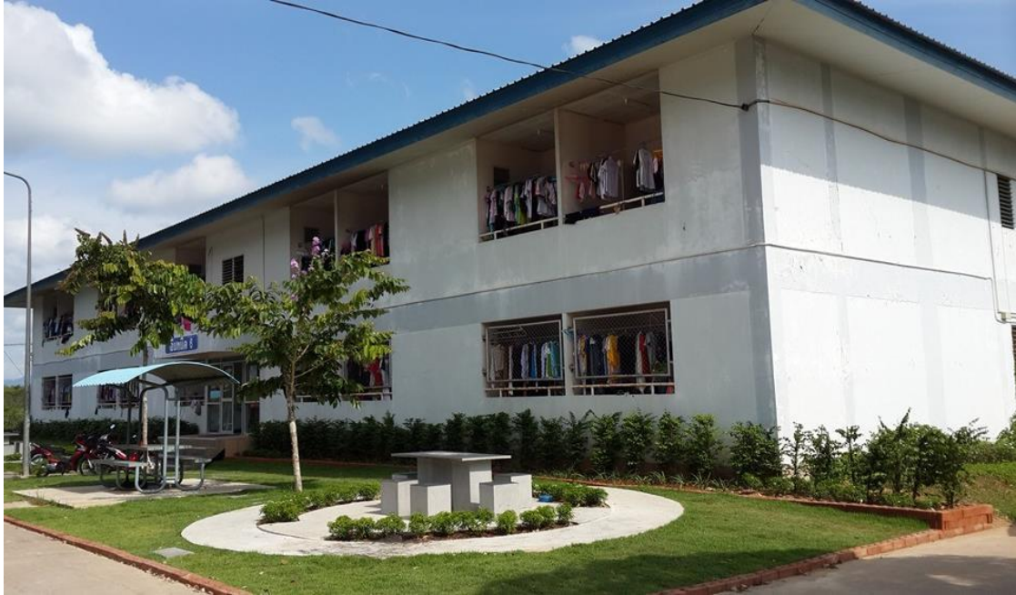
ลักษณะครุภัณฑ์ภายในห้องพัก