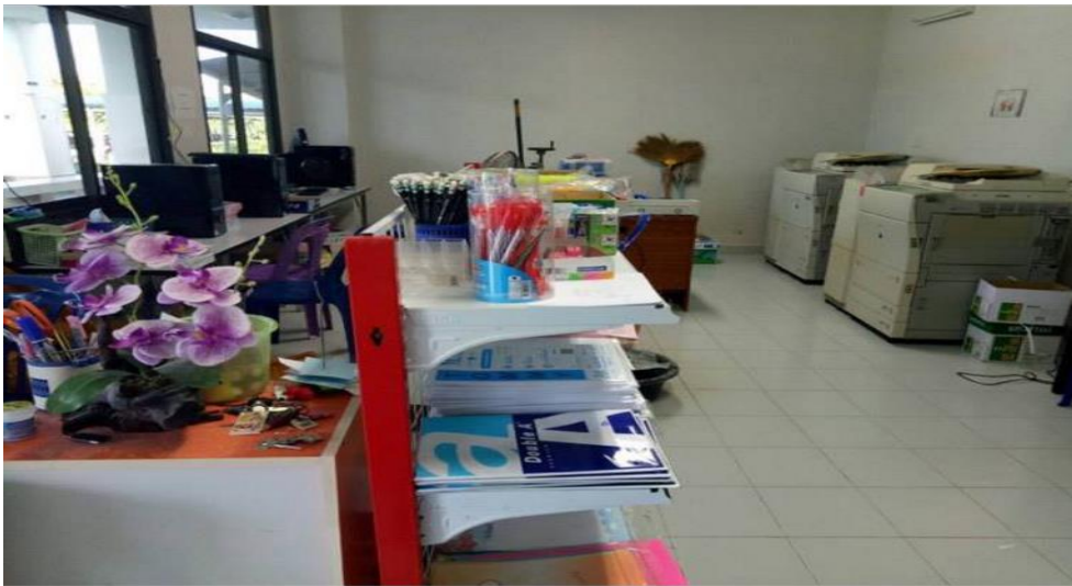
← ร้านถ่าย