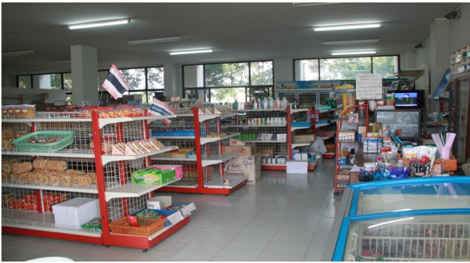
← ร้านค้ามินิมาร์ท