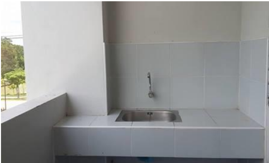
ระเบียงหลังห้องพัก