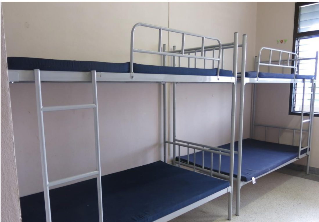
เตียงนอนพร้อมเบาะ