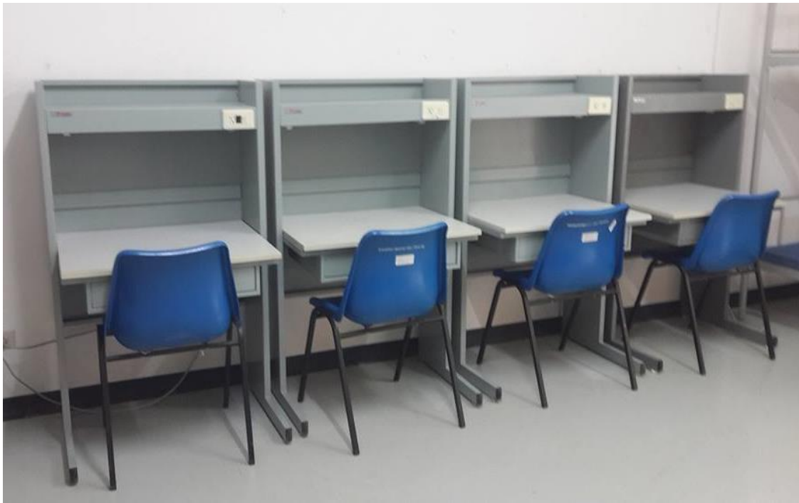
โต๊ะอ่านหนังสือพร้อมเก้าอี้