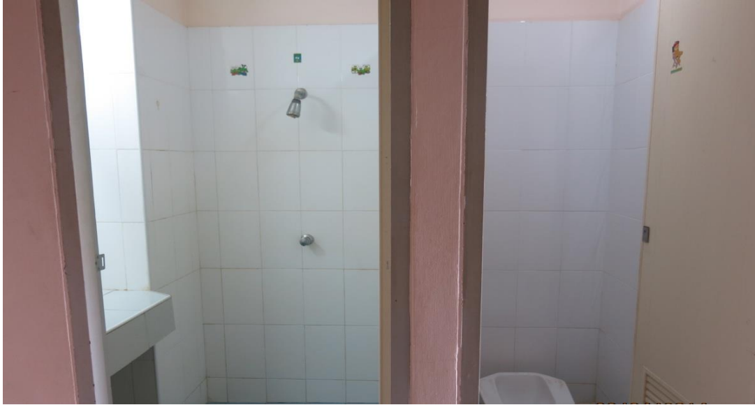
ห้องน้ำภายในห้องพัก