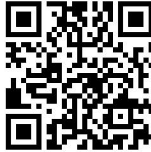
ระบบสั่งซื้อชุดเครื่องแบบนิสิตและซ่อมแซมเครื่องหมาย