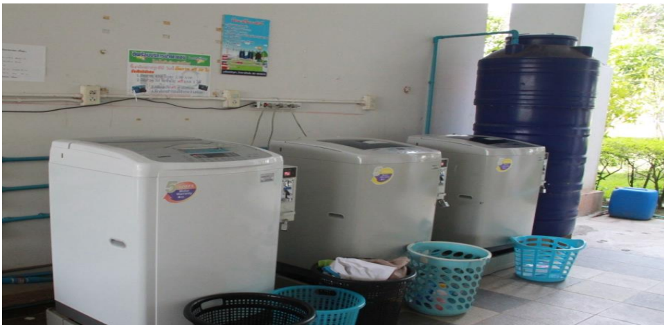
← เครื่องซักผ้า หยอดเหรียญ