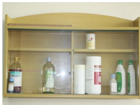
ตู้ยาประหอพัก และสำนักงาน หอพัก