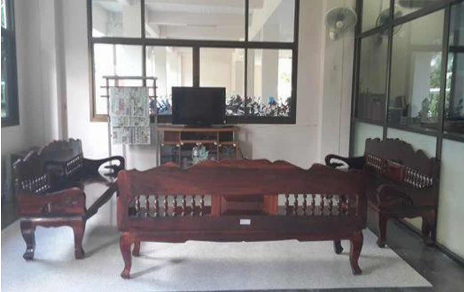
ห้องดูโทรทัศน์ และหนังสือพิมพ์