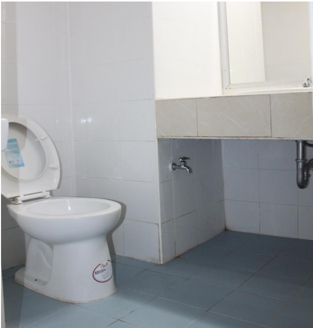
ห้องน้ำภายในห้องพัก